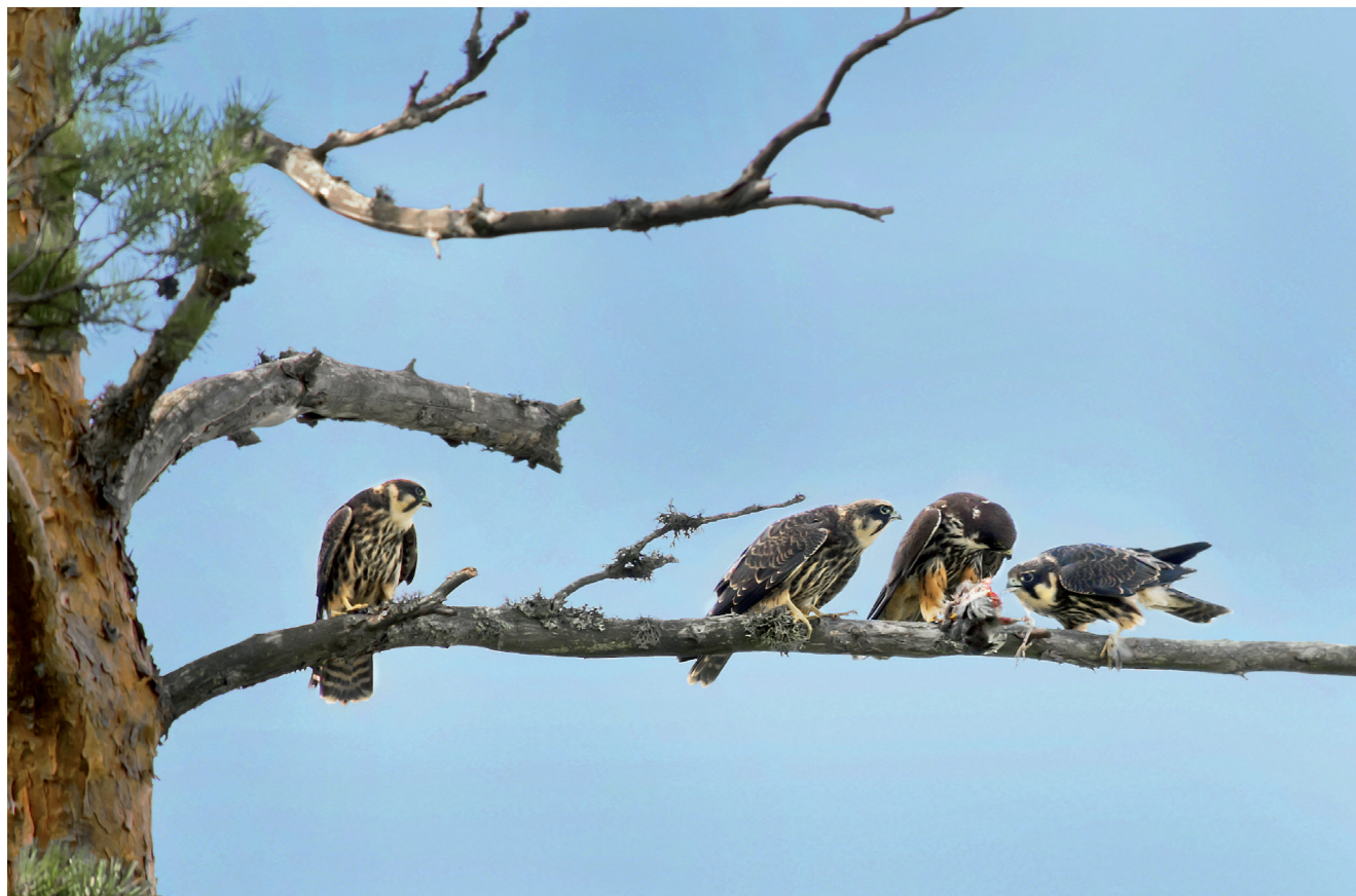
Alla tre lärkfalksungarna vill ha en bit av varje måltid, här vankas det fågel till middag medan de oftast får nöjas sig med trollsländor.